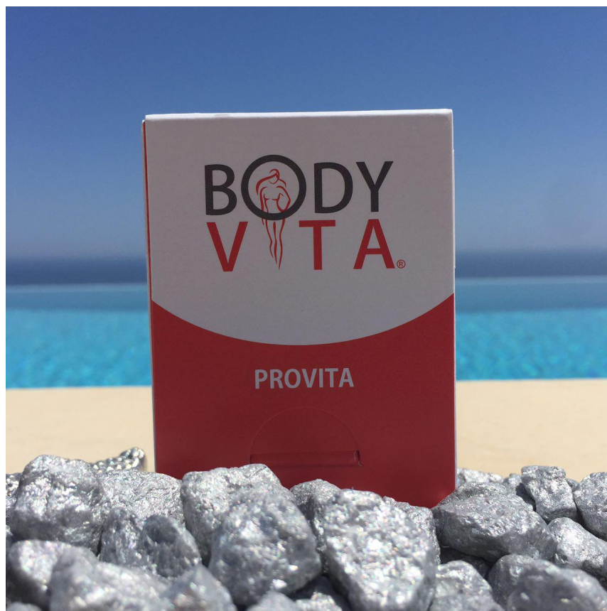
bodyvita - PROVITA - Kapseln